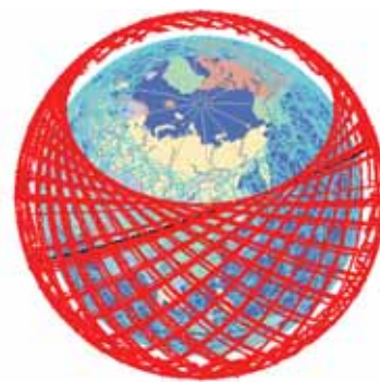
в – Starlink