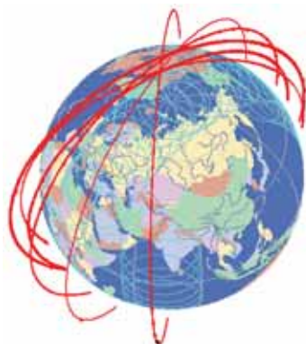
б – OneWeb