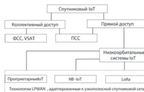
РИС. 1. Классификация спутникового IoT по функциональным и техническим признакам сети (ПСС – системы Iridium, Globalstar, Inmarsat и т. п.; ФСС – системы на основе геостационарных спутников фиксированной спутниковой службы)

Классификацию сервисов спутникового IoT можно провести по критерию требуемой задержки ответа на событие при обработке и доставке пакетов от ОУ к сетевому серверу и серверу приложения и в обратном направлении