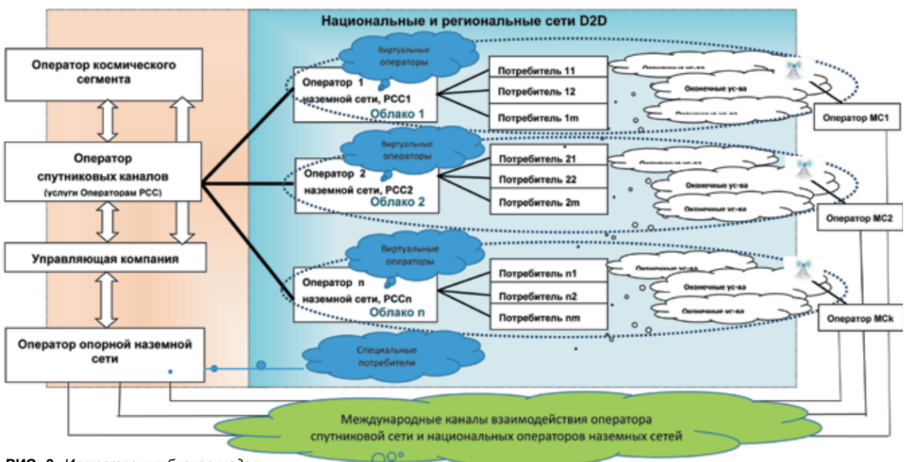
РИС. 3. Иллюстрация бизнес-модели

Авторы выражают благодарность К.В. Лазаренко за помощь в подготовке статьи.