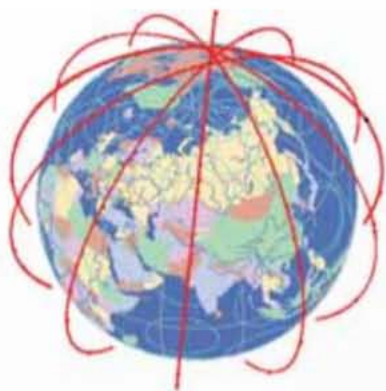
а – Iridium NEXT