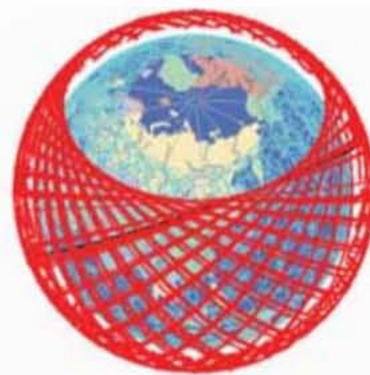
в – Starlink